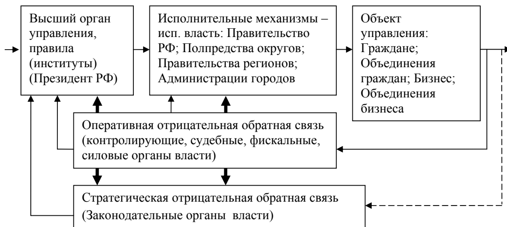
Рис. 1. Действующая кибернетическая модель управления российского общества

вляется управляющее воздействие на подсистемы объекта управления. Исполнительными механизмами в обществе являются исполнительные органы власти всех уровней. Исполнительная власть представляет собой вертикальную иерархически организованную структуру федеральных, окружных, региональных органов исполнительной власти. Каждый уровень власти является одновременно исполнительным механизмом относительно вышестоящего уровня и органом управления относительно нижестоящего уровня (нижестоящих исполнительных механизмов и определённой подсистемы объекта управления). Под воздействием команд управления и влияния внешней и внутренней сред объект управления изменяет параметры своего функционирования, которые необходимо отследить и сравнить с определёнными правилами системы и идеальным представлением о функционировании всей системы. Эту функцию выполняет отрицательная обратная связь.