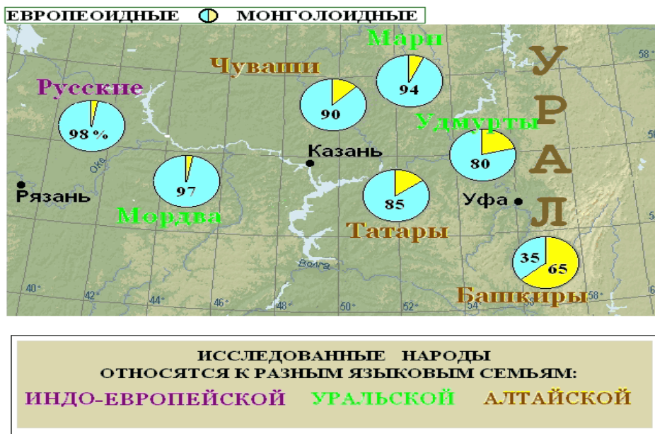
Рис. 1. Распределение монголоидности среди русских и народов Поволжья Источник: Янковский Н.К., Боринская С.А. Наша история, записанная в ДНК \\ Природа, 2001, №6.