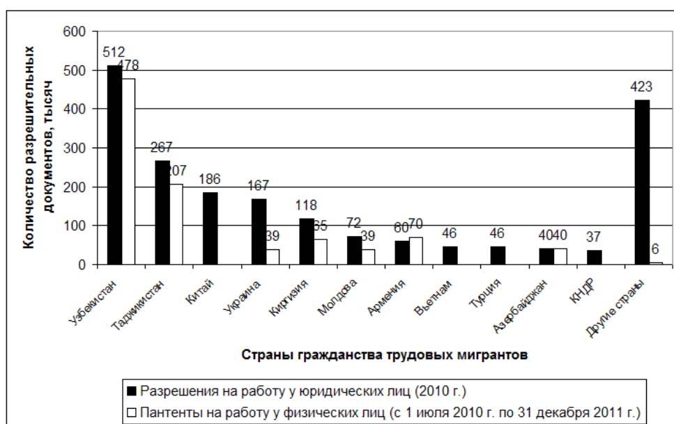
Рис. 1. Количество разрешительных документов, выданных иностранцам на право работы в России в 2010–2011 гг. по странам гражданства, тыс. разрешений

списке стран-доноров мигрантов) [3, с. 5]. По странам «дальнего зарубежья» такой зависимости мы не обнаруживаем. Наибольшее количество заявителей на признание дипломов были из стран Азии и Африки (среди них лидирующие позиции принадлежат Малайзии, Марокко, Ирану и Ираку). В то время, как среди трудовых мигрантов основной поток происходит из Китая, Вьетнама, Турции и КНДР (рис. 1).