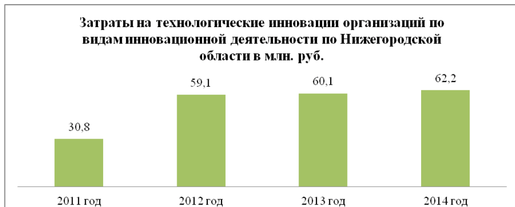
Рис. 3. Рост суммарных затрат предприятий (2011–2014 гг.)

(IV квартал) и уменьшение выпуска на большей части машиностроительных производств, в легкой промышленности и других отраслях возможно компенсировать увеличением добычи и переработки насыщенных углеводородов. В итоге по России и по Нижегородской области рост носит точечный характер и до всеобъемлющего импортозамещения необходимо предпринять множество шагов [2]. Для стимулирования роста считаем необходимым принятие специального закона о промышленной политике в Российской Федерации и соответствующих нормативно-правовых актов в субъектах Российской Федерации. Поскольку одним из ключевых элементов развития промышленного производства являются инвестиции, то в основном привлечением капитала (напрямую, либо путем создания подходящих условий для ведения бизнеса) государство должно направлять развитие тех или иных отраслей промышленности. Но зарубежных и отечественных инвесторов интересуют прежде всего проекты, которые обеспечат максимальную прибыль и скорость возврата денежных средств, вложенных в них.