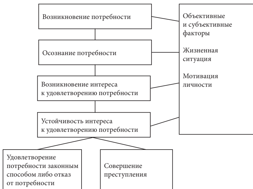
Рис. 1. Формирование мотива преступления.

товки, непосредственного совершения и сокрытия преступления также могут иметь свое внешнее отражение в материальном мире. На основе данного положения мы предлагаем под следовой картиной мотива преступления понимать информацию, отобразившуюся в процессе формирования мотива преступления в виде вербальных или материальных следов, хранящуюся в определенных источниках. Следует заметить, что следовая картина начинает формироваться параллельно с формированием мотива преступления (см. рис. 1). Для каждого этапа формирования мотива будут характерны конкретные источники информации и информация о мотиве преступления.