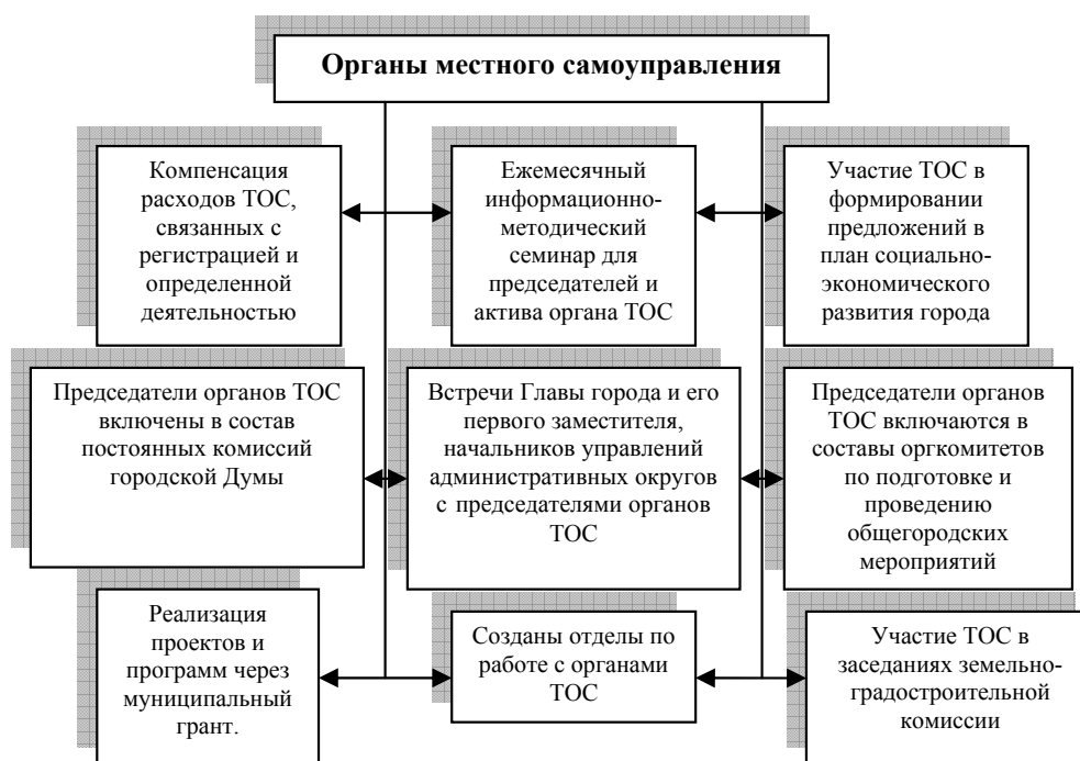
Рис. 2. Основные направления работы органов местного самоуправления с ТОС

Создание и функционирование территориального общественного самоуправления