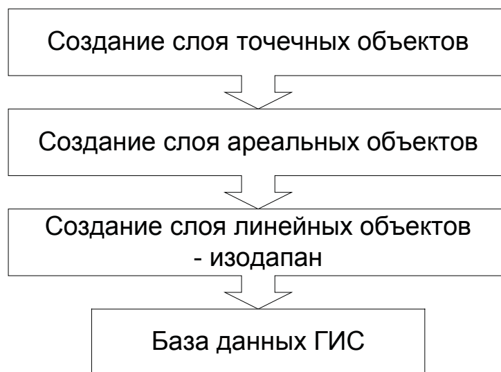
Рис. 2. Создание стратифицированной модели

На первом этапе образуют слой точечных объектов без учета связей и отношений между ними. Локализованные точечные объекты переносят на картографическую модель и отображают в виде графических объектов, создавая слой точечных объектов. При этом каждый ареальный объект характеризуется буферной зоной, которая характеризует его информационные потребности. Примером такого объекта является предприятие, отдельный дом, жилой массив.