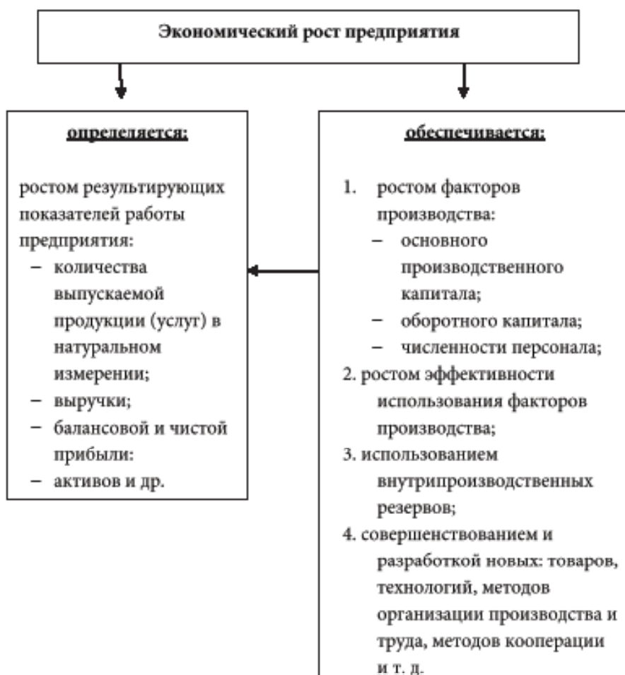
Рис. 1. Определение и обеспечение экономического роста предприятия