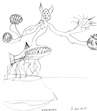
Рис. 1. Фрагмент рисунка испытуемого экспериментальной группы, демонстрирующего образную адаптивную гибкость

Ниже представлен пример «образной адаптивной гибкости – способности изменить форму стимула таким образом, чтобы увидеть в нём новые признаки и возможности для использования» [6, с. 186]: рисунок животного, которое, по словам автора рисунка, «один, но их бесконечность (держит сам себя)», проживающее «в одиночку с семьёй – ведь он один, но он держит сам себя».