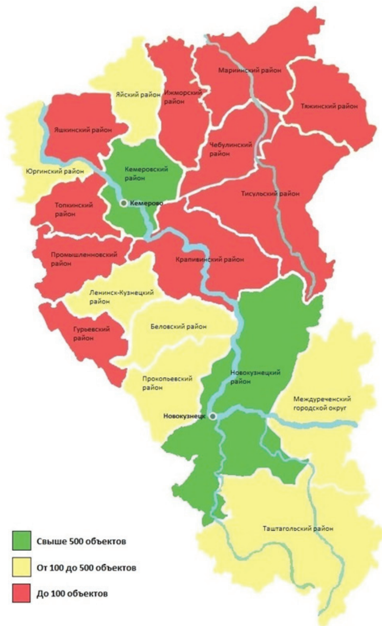
Рис. 2. Размещение объектов гостиничной индустрии в Кемеровской области

тверждает анализ туристской статистики по целям поездки. Именно Новокузнецк и Кемерово являются центрами делового туризма в регионе. Кроме того, в расположенных вблизи этих городов загородных отелях, туристических базах и