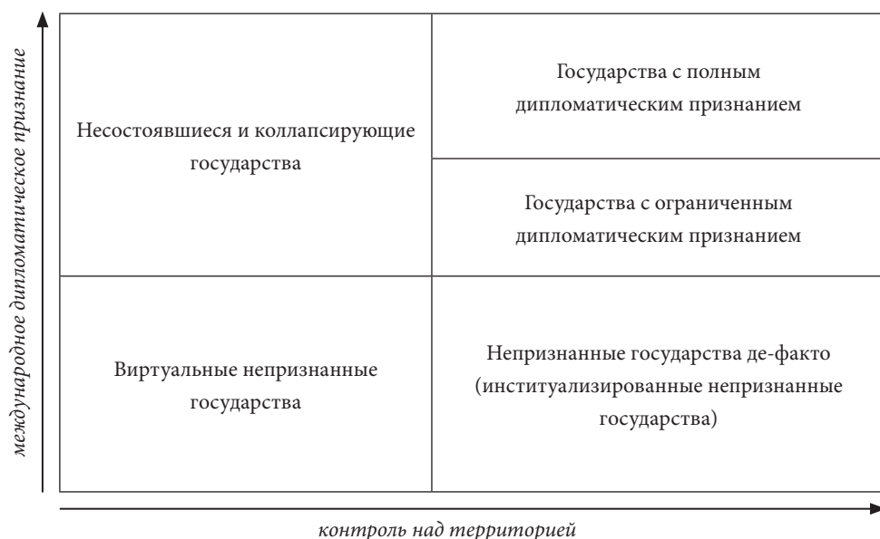
Рис. 1. Различные формы государственных и псевдогосударственных образований в современном мире

не отменяет ее положение как одного из пяти постоянных членов Совета Безопасности ООН, обладающих правом вето.