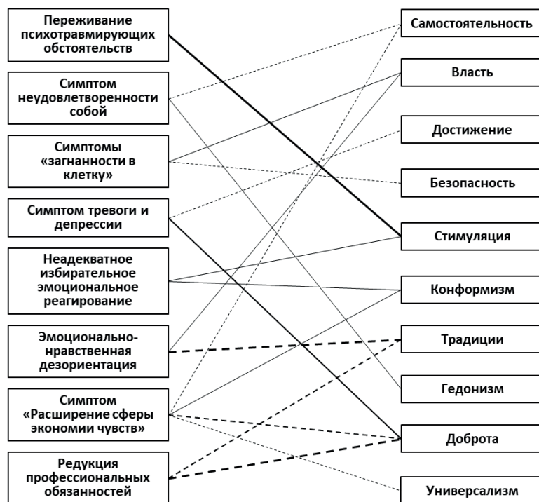
Рис. 3. / Fig. 3. Корреляционные связи между степенью выраженности симптомов эмоционального выгорания и показателями ценностных приоритетов специалистов экстремального профиля / Correlation links between the severity of symptoms of emotional burnout and indicators of value priorities of specialists in extreme profile