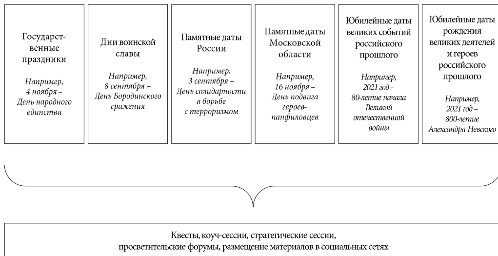
Рис 1 / Fig. 1. Календарь патриота / Patriot Calendar

С учётом сказанного в некоторых регионах страны (например, в Московской области) уже сегодня выстраивается собственная модель патриотического воспитания, а также определяются критерии её результативности (рис. 1–2).