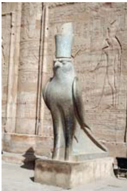
Рис. 2 / Fig. 2. Бог Гор / God of Horus.

века с головой сокола в царской короне (рис. 2). [11, с. 210].