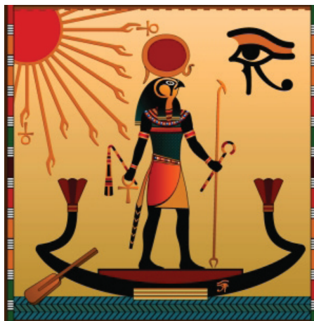
Рис. 1 / Fig. 1. Бог Ра / God Ra

– Бог солнца и солнечного света Ра (а также полуденного солнца) изображался в виде сокола или человека с головой сокола, на которой находился солнечный диск (рис. 1) [3, с. 53].