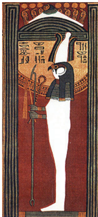
Рис. 3 / Fig. 3. Бог Сокар / God Socar