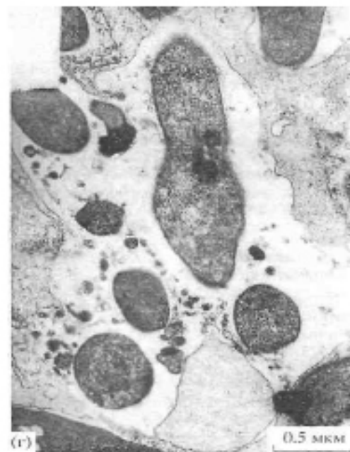
Ультраструктура инфицированных клеток клубеньков - а, в - “зрелая” клетка, б, г - “старая” клетка