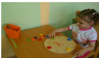
1 этап – ориентация на палитре, формировали понятия верх – низ, право-лево, такой же.

Работа по формированию предпосылок письменной речи у старших дошкольников с ЗПР велась концентрически в 4 этапа: