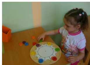
2 этап – на этом

ориентироваться на палитре и дифференцировать фишки. После того как дети безошибочно выполняют задания педагога, следует перейти ко второму этапу работы. В целом, для детей с ЗПР характерно пребывание на первом этапе от 2 недель до 1 месяца, в зависимости от уровня сформированности пространственных представлений, зрительно-моторной координации.