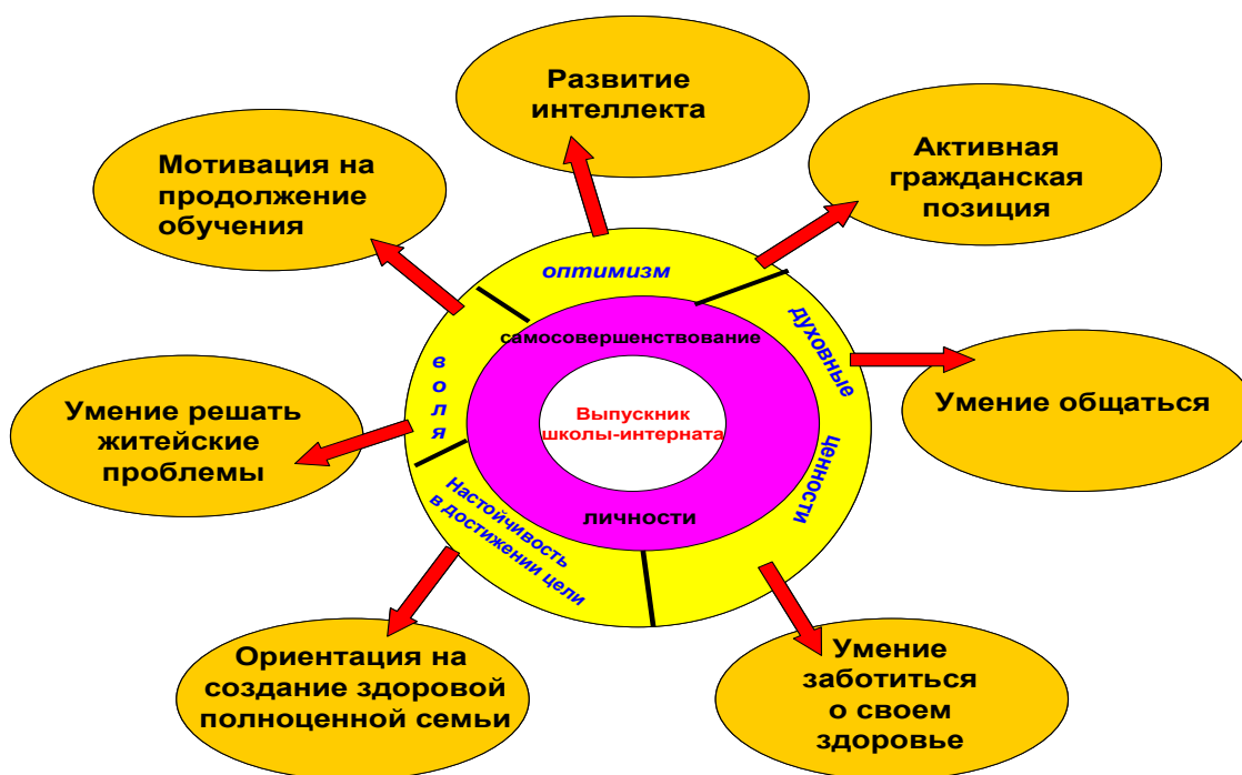
Модель выпускника школы-интерната

ции взаимодействия с социальными институтами и учреждениями, использование их воспитательного потенциала создают такую воспитательную систему интерната, которая обеспечивает его выпускникам высокий уровень социализации, формирование социально зрелой личности.