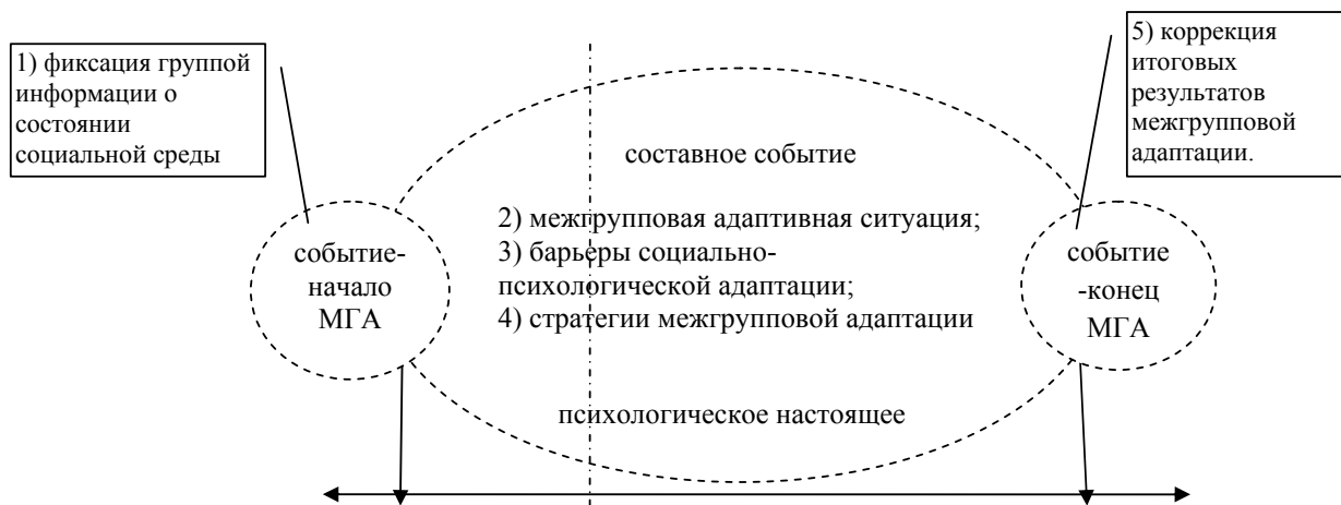
Рис. 3. Временная структура межгрупповой адаптации

Таким образом, начальное и конечное – элементарные события связаны друг с другом как начало и конец единого однородного процесса. Указанные три элемента образуют составное событие – межгрупповую адаптацию.