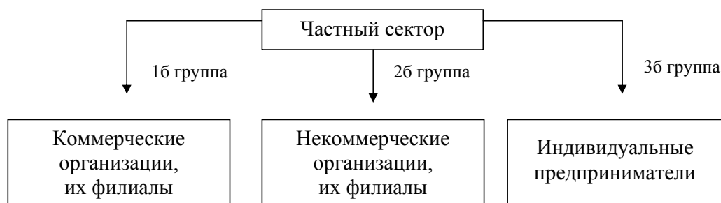
Рис. 2. Участники ГЧП со стороны частного сектора.

Прежде чем определять элементы ГЧП, которые могут вступать в рассматриваемое сотрудничество со стороны частного сектора, целесообразней сформулировать понятие частного сектора. Под частным сектором понимается совокупность экономических хозяйствующих субъектов (частных партнёров) активы, которых на момент вступления в ГЧП, принадлежат частным лицам, то есть не имеют никакого отношения к государственной власти в части собственности на них. Из понятия частного сектора следует, что участниками ГЧП могут быть частные юридические лица, их филиалы, индивидуальные предприниматели. Частные партнёры могут являться как резидентами, так и не резидентами РФ (рис. 2). Рассматривая участников ГЧП со стороны частного сектора можно сделать вывод, что активнее всего участие в изучаемом альянсе принимают участники группы 1б, поскольку их основная цель – извлечение прибыли. Прибыль можно получать в различных видах (денежные средства, освобождение от уплаты каких-то налогов либо получение рассрочки по уплате налогов или иные льготы и преференции). Некоммерческие организации преследуют достижение социальных либо иных нематериальных целей. Их участие может быть очень важным, потому что цели таких организаций и государства схожи и близки друг к другу. Индивидуальные предприниматели вряд ли будут стремиться к участию в таких партнёрских отношениях, поскольку они ориентированы на мелкий бизнес, хотя цели индивидуального предпринимателя и коммерческой организации схожи.