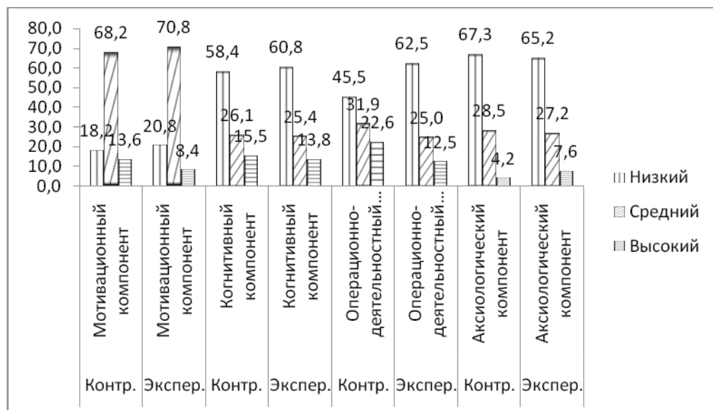
Рис. 1. Исходный уровень сформированности компонентов профессиональной компетентности студентов СПО