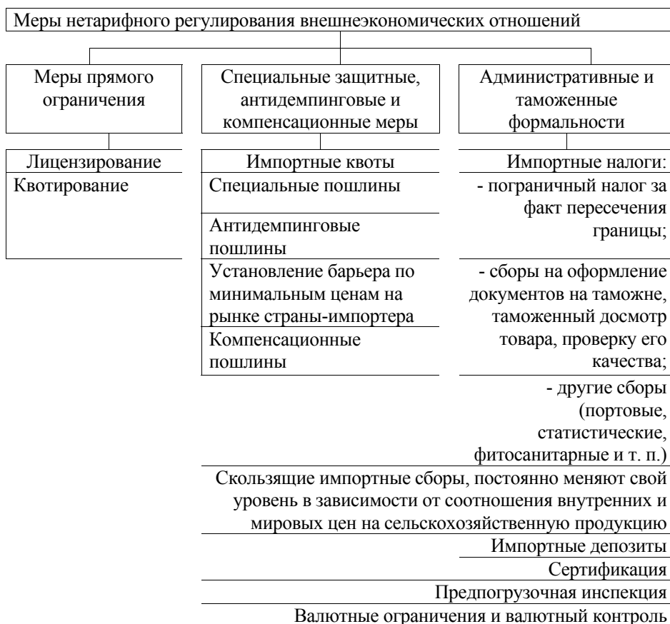
Рис. 4. Классификация методов нетарифного регулирования внешнеэкономической деятельности

Для Дальнего Востока России в целом и Приморского края в частности исторически одной из приоритетных отраслей экономики является рыбохозяйственная. Этот факт подтверждает недавнее принятие специальной государственной программы «Развитие рыбохозяйственного комплекса Приморского края на 2013–2017 годы» [3]. Рыбное хозяйство признано стратегической отраслью для страны, так как ее успешное развитие будет способ-