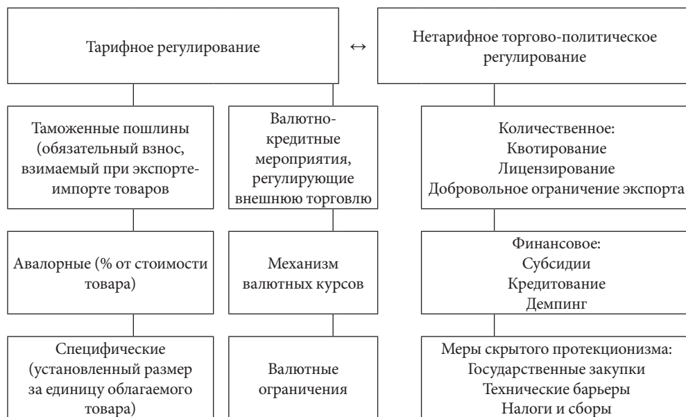
Рис. 1. Инструменты тарифного и нетарифного таможенного регулирования

Основные постулаты таможенной политики напрямую связаны с принципами государственного регулирования внешнеторговой деятельности, сформулированными в Федеральном законе «Об основах государственного регулирования внешнеторговой деятельности». У внешнеэкономической политики на вооружении значительный арсенал эффективных методов регулирования деятельности, классификация которых приведена в табл. 1. В соответствии с Федеральным законом «О таможенном тарифе» определены основные цели осуществления тарифного регулирования: