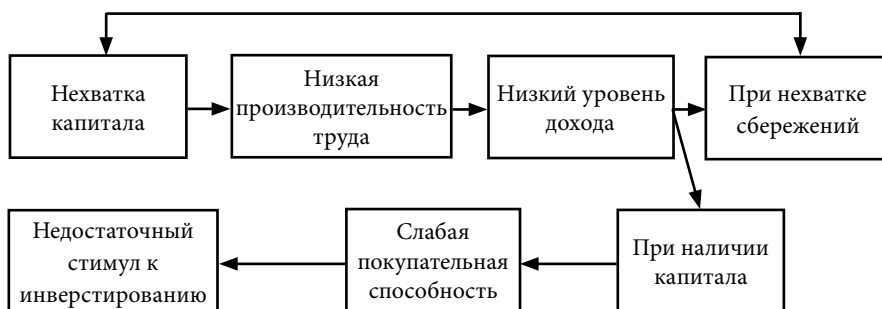
Рис. 1. «Порочный круг» нехватки капитала по Р. Нурксе [7]

Численность населения с денежными доходами ниже прожиточного минимума в 2012 г. по сравнению с 2011 г. снизилась с 18,0 млн. человек до 15,8 млн. человек, что составило 11,2 % общей численности населения. Превышение денежных доходов населения над денежными расходами составило 15,5 млрд. руб., что на 56,1 млрд. руб. меньше, чем в 2011 г. и ожидаемо ведет к уменьшению потребительского спроса. В связи со сложившейся ситуацией в России, где имеется большое количество людей живущих за чертой бедности, следует обратиться к теории «порочного круга нищеты». Эта теория впервые была сформулирована в 50-х гг. прошлого столетия для анализа экономики слаборазвитых стран и имеет несколько вариантов. Одна из разновидностей теории рассматривает соотношение внутреннего рынка и нехватки ресурсов для модернизации: нехватка капитала определяет низкий уровень производительности труда, что в свою очередь, обуславливает низкий уровень доходов. Отсюда – слабая покупательная способность и, как следствие недостаточные стимулы