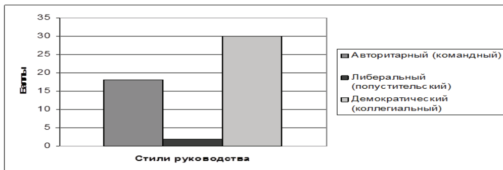
Рис. 1. Количество выборов экспертов приоритетных стилей руководства для главы муниципального образования (в сырых баллах)

По итогам экспертного опроса сотрудников выявлены профессионально важные качества, необходимые главе городского округа для успешного выполнения его профессиональной деятельности: гражданская ответственность, патриотизм, высокие интеллектуальные способности, длительная работоспособность, преобладание мужественного стиля поведения, решительность, гибкость, уверенность, практичность и др.