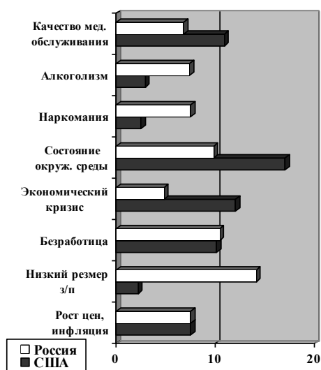
Рис. 2. Современные проблемы, волнующие студентов, 2012 г., %

нить экологическую культуру российского и американского студенчества, свидетельствуют о том, что, несмотря на внедряемые в образовательный процесс программы, проведение практических занятий, расширение социальными агентами трансляций об экологических проблемах, экологическая сознательность молодых людей находится на крайне низком уровне (см. рис 2 и 3).