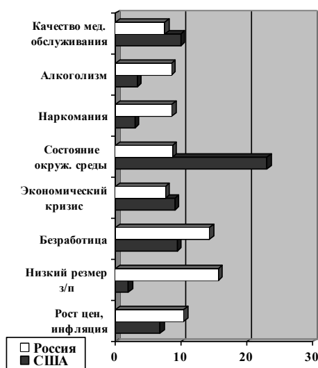
Рис. 3. Современные проблемы, волнующие студентов, 2015 г., %

Таким образом, очевидно, что деятельность экологических организаций в России является недостаточной. Она не получила широкого распространения, имеет лишь формальное институциональное оформление и требует соответственно дальнейшего развития и совершенствования.